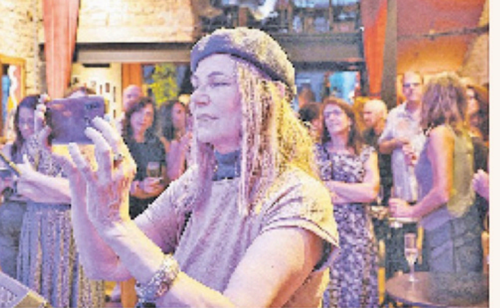
Belchior: A Urgência do Palco