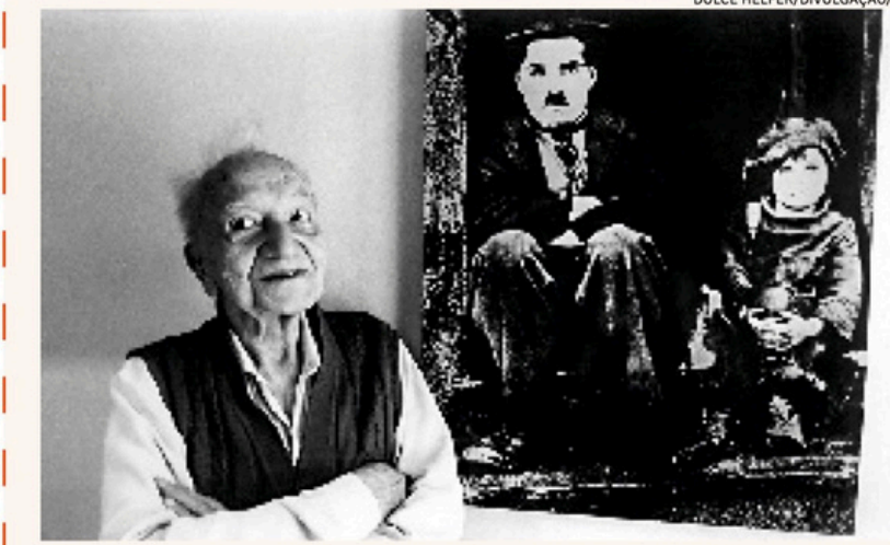
Mario Quintana: A Poesia do Invisível