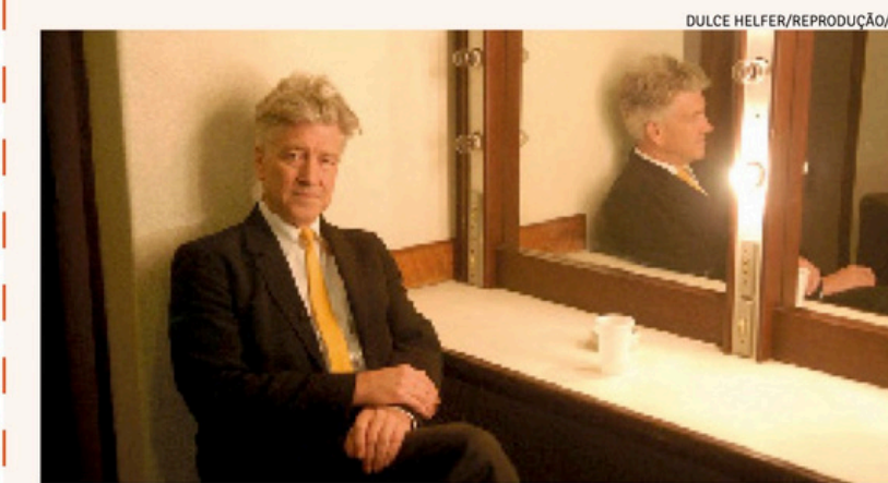
Caio Fernando Abreu: O Espelho da Alma